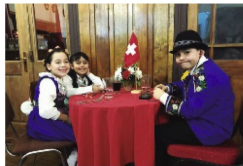
Los más pequeños de la fiesta con trajes típicos