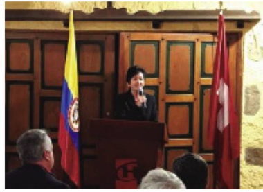
Celebración en el Club suizo de Bogotá