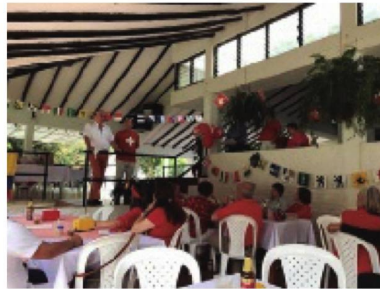
Celebración en Cali