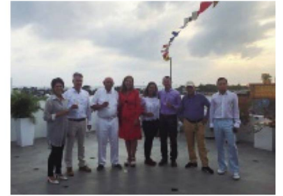
Fiesta nacional en Cartagena