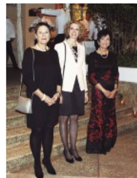
La Embajadora de Suiza en Colombia, Yvonne Baumann