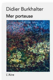
DIDIER BURKHALTER: "Mer porteuse". Éditions de L'Aire, 2018, 194 págs., CHF 24.-, Euro 24.-

Mer porteuse , tercera obra de Didier Burkhalter, surgió junto al lago de Neuchâtel; su prosa poética nos cuestiona sobre la ascendencia y la fuerza de nuestras raíces familiares. El personaje central de esta historia de un niño abandonado es el Atlántico, símbolo de separación, pero también de unión entre las personas. El libro del ex Consejero Federal es de estilo agradable, como en ese fragmento donde los penachos de humo de un transatlántico conectan el buque con el cielo, "como si temiese ser tragado por las profundidades". ¿Sus puntos débiles? Una cierta pesadez o ampulosidad en la formulación, en virtud de la cual la indiferencia no puede ser sino "sobrecogedora" y, obviamente, será un "océano de desesperanza" el que termine sumergiendo a uno de los personajes de la novela.