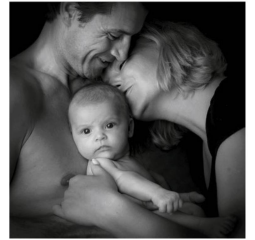
Panorama Suizo / Mayo de 2019 / Nº3