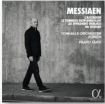
PAAVO JÄRVI: "Messiaen" Tonhalle-Orchester, Zürich Alpha 2019

¿Por qué Messiaen? Paavo Järvi había estado esperando esta pregunta. Con aire relajado, el nuevo director principal de la Orquesta de la Tonhalle de Zúrich responde: "Porque me encanta Olivier Messiaen. Su música es grandiosa y se toca muy poco. Vamos a lanzar una pequeña colección de sus obras maestras en CD".