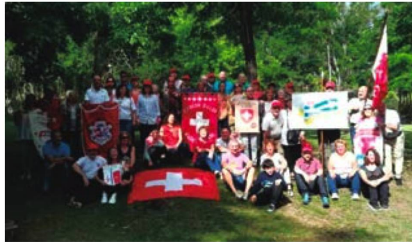
Las delegaciones en el parque del Albergue “El Rincón”

Con respecto al Viaje a Suiza, pensado para descendientes de suizos que nunca hayan viajado a su tierra de origen,