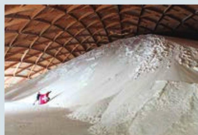
La cordillera secreta de Suiza: dentro de la cúpula de almacenamiento de sal en Riburg, Argovia.

La Embajada de Suiza y el Centro Consular Regional, les desean Felices Fiestas y un próspero Año Nuevo