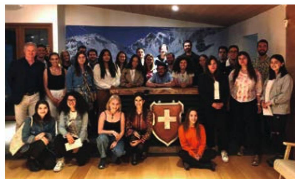
Jóvenes suizos de Chile y Argentina en el Club Suizo de Santiago