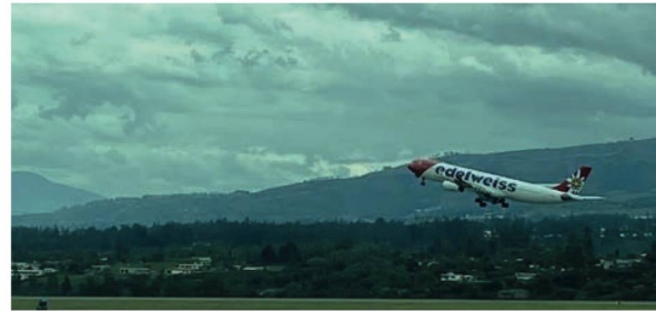
Check in en el Aeropuerto Internacional Mariscal Sucre/Quito