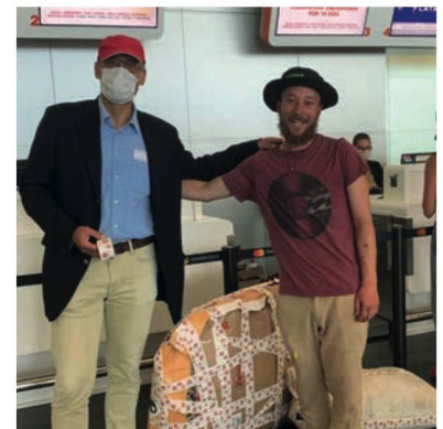
El Sr. Embajador y el agradecido ciclista con su bicicleta

Mientras las fronteras están cerradas en la mayoría de los países latinoamericanos por la epidemia de COVID-19, la Embajada ha estado trabajando con el gobierno suizo, autoridades locales en Uruguay y Paraguay, otras representaciones y varias aerolíneas a fin de brindar a suizos y suizas varados en Latinoamérica oportunidades para volver a su casa y apoyarlos en su regreso. Principalmente, se trató de hacer disponibles informaciones relevantes y coordinar esfuerzos para viajar y cruzar fronteras en las circunstancias actuales. Por ejemplo, el gobierno uruguayo permitió a pasajeros de cruceros viajar en seguridad usando un "cordón sanitario" del Puerto de Montevideo al Aeropuerto de Carrasco, fuera de