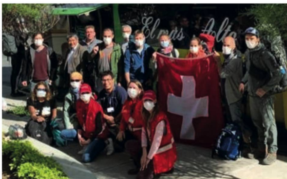
TURISTAS SUIZOS EN LA PAZ ANTES DEL VIAJE EN BUS A SANTA CRUZ (31.03)

Después del 21.03.2020 aún había 90 turistas suizos varados en Bolivia. La Embajada de Suiza en Bolivia realizó la tarea de contactar a todos estos turistas que habían registrado su viaje en Bolivia vía la aplicación Travel App. Por el hecho de que Bolivia no contaba con un número de turistas suizos suficientemente alto, no era posible organizar un vuelo de repatriación directo a Suiza. Por lo tanto, la única esperanza de la Embajada de Suiza en Bolivia era obtener algunos asientos para ciudadanos suizos en vuelos organizados por otros países europeos. Gracias a la Embajada de Francia y a la Embajada de Alemania en Bolivia, más de sesenta suizos pudieron salir del país entre el día 21.03.2020, cuando empezó la cuarentena total hasta el día sábado 04.04.2020.