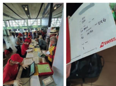
Antes del vuelo, Aeropuerto Arturo Merino Benítez