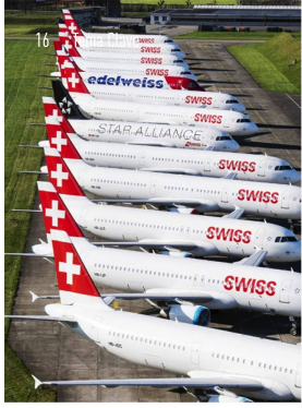
Imágenes del confinamiento que no se olvidarán: la flota de SWISS permanece inmovilizada casi por completo. Lucerna, urbe cosmopolita, luce sin turistas; se disparan las ventas de bicicletas en Suiza; y el recuerdo de días soleados en la Península de los Balcones.