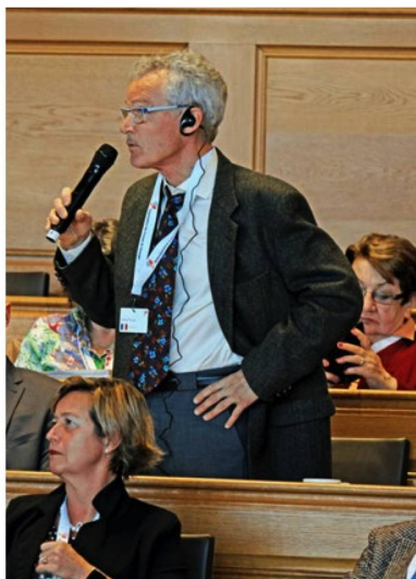
El Parlamento de la “Quinta Suiza” se reúne con regularidad en Berna. En la imagen: un debate durante la sesión del CSE, en marzo de 2018.

El CSE se reúne dos veces al año para expresarse sobre asuntos directamente relacionados con los suizos en el extranjero y defender así sus intereses. La sesión de primavera se celebrará en Berna en marzo, y la de otoño en agosto, en el marco del Congreso de los Suizos en el Extranjero. Los delegados participan a título voluntario y se comprometen por un período de cuatro años (2017–2021). Son elegidos por las comunidades suizas en el extranjero. Durante las sesiones, el CSE puede aprobar resoluciones y recomendaciones dirigidas a las autoridades, a instituciones o a la opinión pública. (JF)