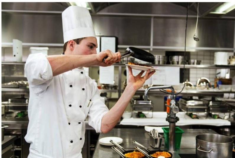
Recorrer el mundo como cocinero suizo: quienes trabajan en el extranjero no deben descuidar su previsión para la vejez.

Sin embargo, la Sra. B no podrá conservar su seguro obligatorio si durante su estancia en China trabaja para un empleador con sede legal en China.