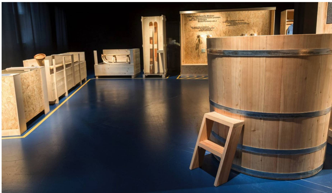
Productos alpinos entre tradición e innovación: las cubas de leche herméticas sirven también como cabinas de sauna.