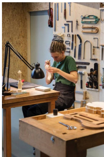
Los aprendices de la escuela de manufactura de violines de Brienz muestran su pericia.

“ Werkstatt Alpen. Von Macherinnen und Machern ” [Taller Alpino: creadores y creadoras], Museo Alpino Suizo de Berna, hasta el 27 de septiembre de 2020. www.alpinesmuseum.ch