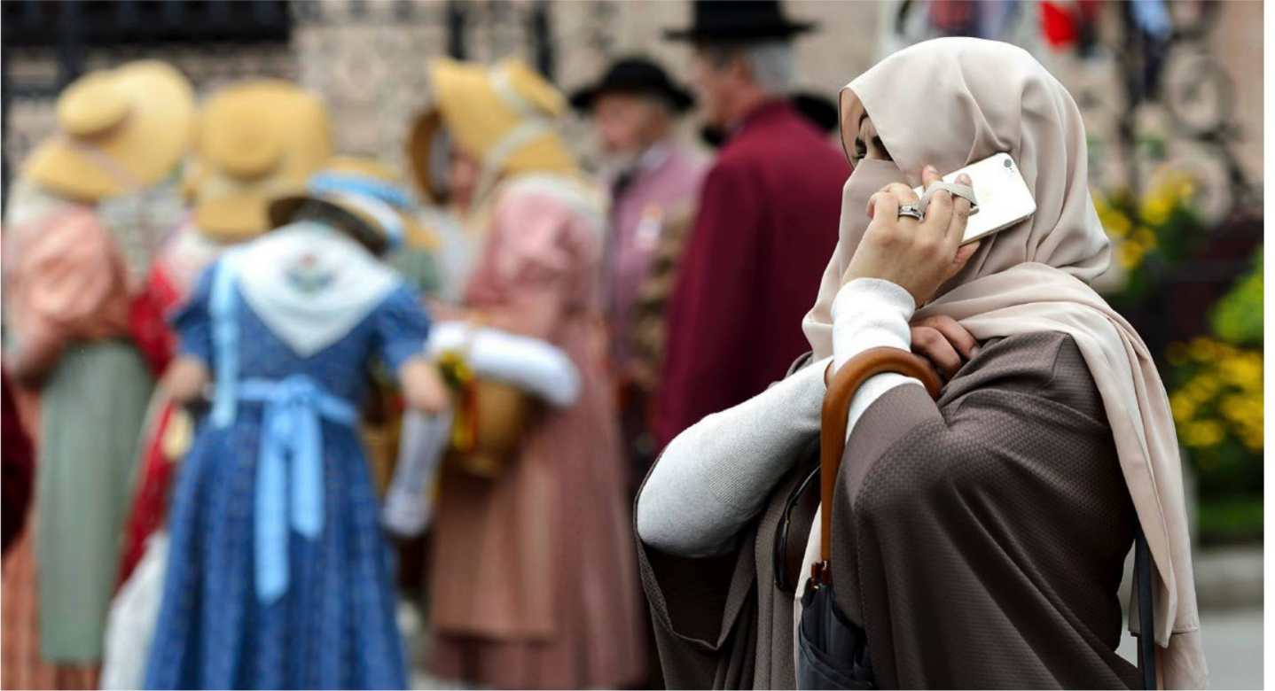
Una turista con velo integral se topa en Ginebra con un grupo folclórico local: el Comité de Egerkingen desea prohibir este tipo de encuentros.