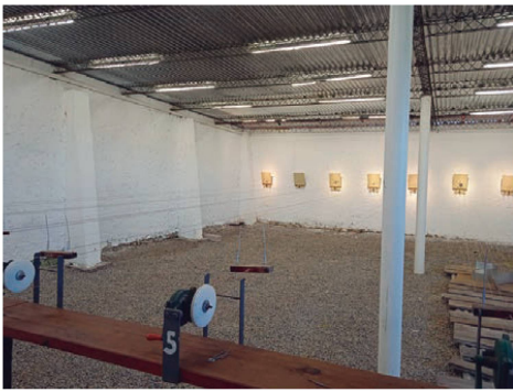
Pedana de armas de aire comprimido