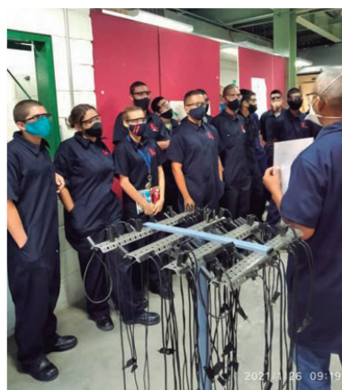
Protección y prevención del Covid-19 en el Instituto Henri Pittier