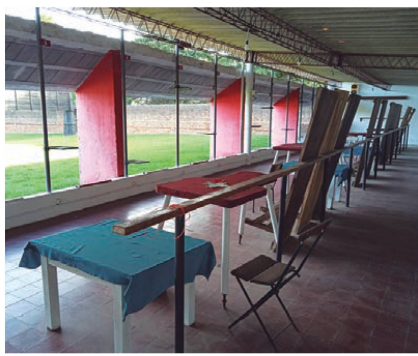
Línea de fuego pedana de armas largas