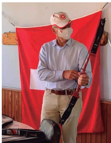
El Embajador de Suiza visita el Tiro Suizo Paysandú