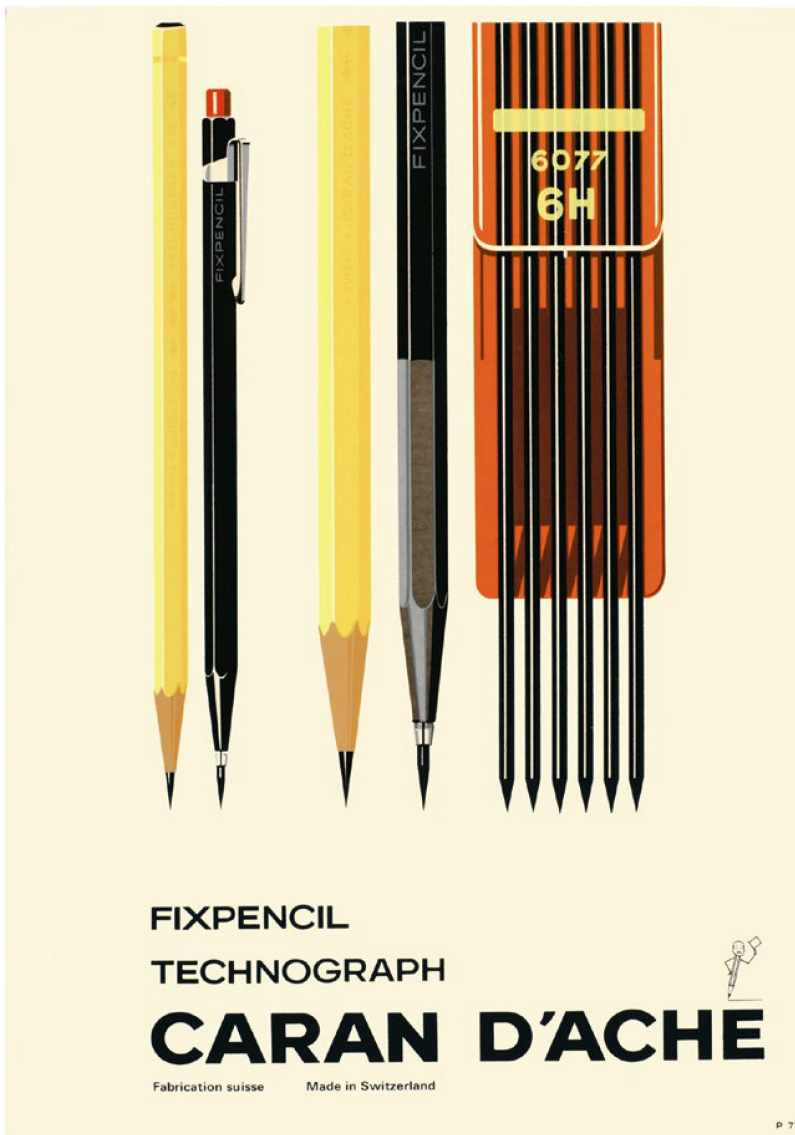
En 1930, la empresa patentó el primer portaminas del mundo. El "Fixpencil" obtuvo gran éxito, sobre todo entre los diseñadores técnicos