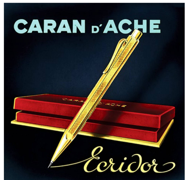
Con su toque lujoso, el bolígrafo hexagonal "Ecrivor" fue todo un éxito: a partir de 1953 se vendieron millones de ejemplares