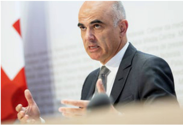
El Ministro de Salud, Alain Berset, considera el rotundo “Sí” una muestra de aprecio y agradecimiento al personal de enfermería.

En caso de prevalecer este procedimiento de dos vías, el Consejo Federal tendrá que concretar las demás demandas en un plazo de 18 meses, mostrando en particular cómo lograr que el personal sanitario esté más satisfecho en el día