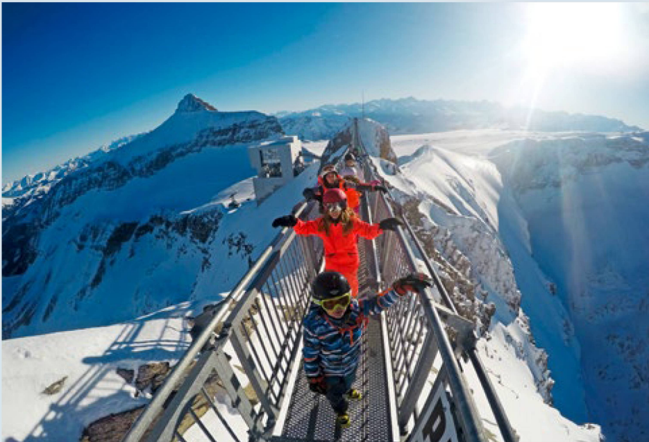
Inolvidable recuerdo del campamento: la pasarela “Peak Walk”, que une dos cumbres. Foto de archivo, puesta a disposición

Del 2 al 8 de enero de 2023 participarán jóvenes de 13 y 14 años, procedentes de toda Suiza, en una semana de deportes de nieve en Lenk (Oberland bernés). Entre los 600 que obtengan plaza por sorteo, 25 serán de la “Quinta Suiza”.