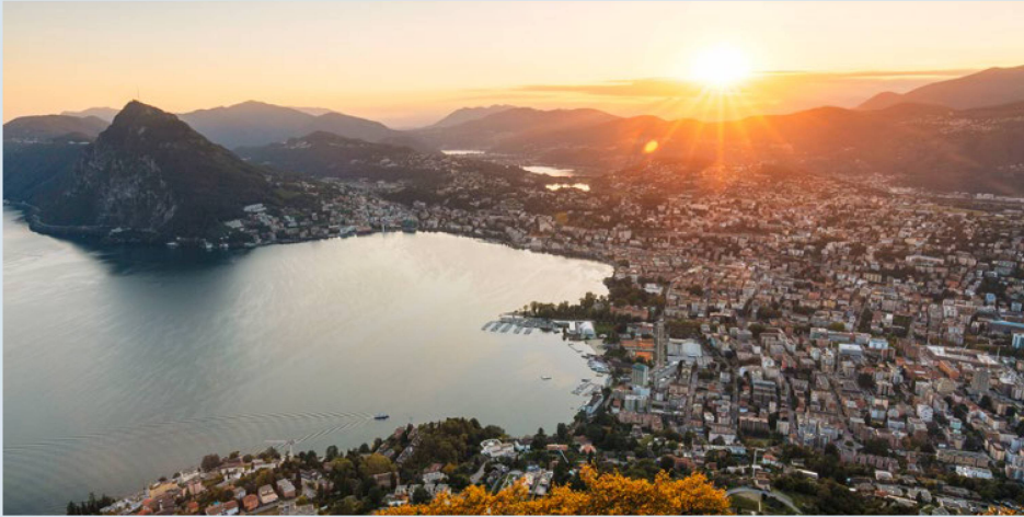
Un marco encantador para el Congreso: el ambiente vespertino del "Golfo de Lugano".

¿Qué retos plantean los grandes temas de hoy al sistema democrático suizo? En torno a esta pregunta de candente actualidad girará el Congreso de los Suizos en el Extranjero, que se celebrará los días 19 y 20 de agosto de 2022, en Lugano. A los participantes en el Congreso no les faltará material de debate.