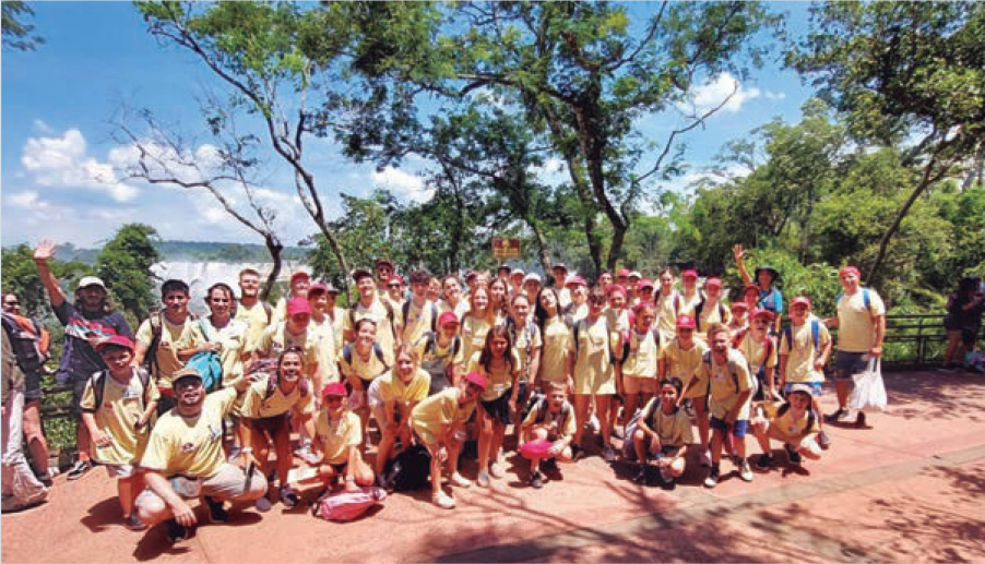
Visita a las Cataratas del Iguazú