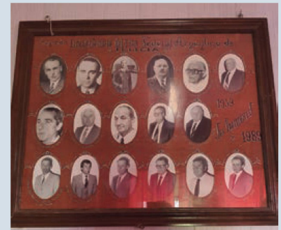
Año 1989: A 100 años de su fundación