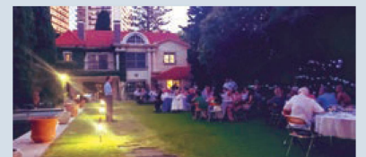
Festejo de Fin de Año en la residencia del Sr. Embajador con los jóvenes, el Club Suizo y la Sociedad Tesinesa