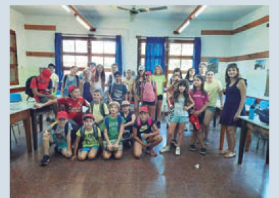
Los más pequeños en el taller de francés