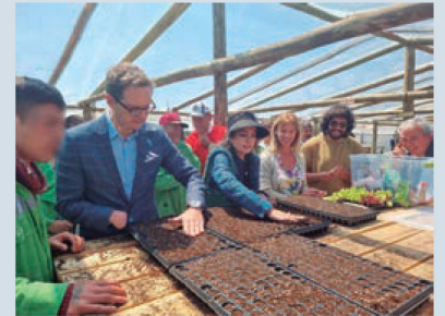
Programa "Sembrando Nuestra Huerta"

(ANGELA RODRIGUES ROBERTO - EMBAJADA DE SUIZA)