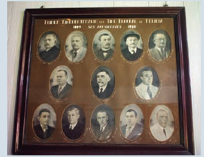
Año 1939: A 50 años de su fundación

En el marco del Encuentro Cultural “Suiza, ayer y hoy en Argentina”, organizado por la Federación de Asociaciones Suizas de la República Argentina FASRA y Entidades Valesanas Argentinas EVA, los días 30 de septiembre y 1º de octubre de 2022, se presentó el libro “Recetas de nuestras abuelas suizas”, un proyecto de EVA que se gestó durante la pandemia y mantuvo activas y creativas a las asociacio-