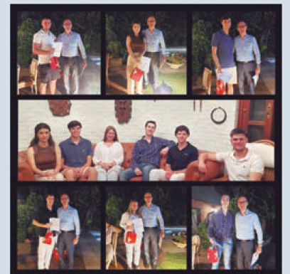
Celebración de la mayoría de edad (Uruguay)