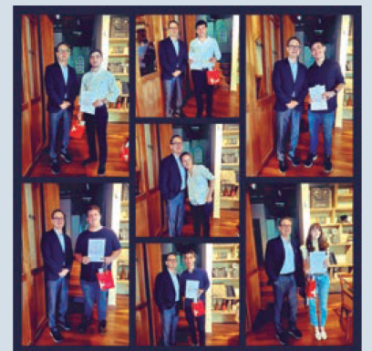
Celebración de la mayoría de edad (Paraguay)