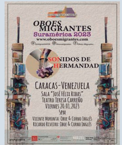
Evento Oboes migrantes