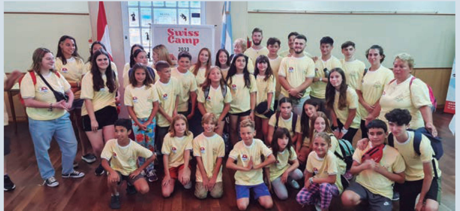
Santa Fe: la partida hacia una gran experiencia