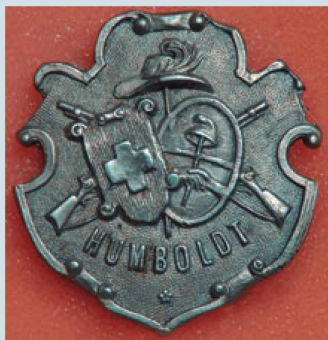
Medalla acuñada en la época y que identificaba a los miembros de la Sociedad de Tiro Suiza Argentina de Humboldt

La primera sociedad de tiro al blanco fundada en la Provincia de Santa Fe fue el Tiro Suizo de San Carlos en 1862 (nota publicada en Panorama Suizo N° 3 de 2021) y en 1866 se organizó la Sociedad de Tiro Suizo en la Colonia Esperanza. Los habitantes de las colonias practicaban asiduamente el ejercicio del tiro al blanco, en ese tiempo el deporte de más alta jerarquía.