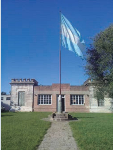
Edificio del Tiro Federal Argentino de Humboldt

del frente de la Sede Social. Éste fue el último año en el que la institución contó con soldados armeros que atendían el polígono.