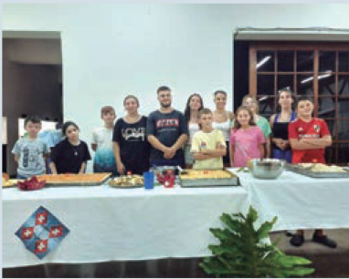
Taller de cocina