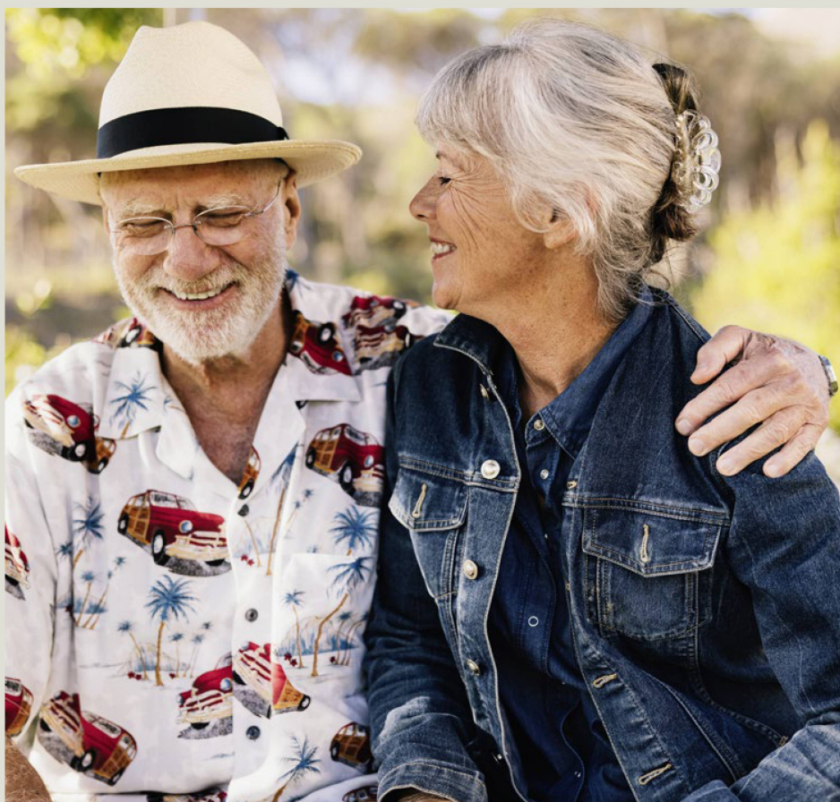
Disfrutar de la jubilación en el extranjero: un sueño de muchos suizos.

La iniciativa de la Dirección Consular partió de una propuesta de nuestra ex Jefa de Misión en Tailandia, Helene Budliger Artieda, quien planteó la problemática incluso antes de que se emitiera un mandato político para aclararla. Para tener una visión más precisa de los problemas, se llevaron a cabo una serie de estudios detallados, así como una encuesta dirigida a las representaciones de 25 países. De esta manera quedó confirmada la lista de los principales ámbitos problemáticos: pensiones, seguros y cuestiones relacionadas con ciertos servicios especializados, como el seguro de enfermedad, el SVS o los fondos de pensiones. Otros temas son, por ejemplo: información general en mate-