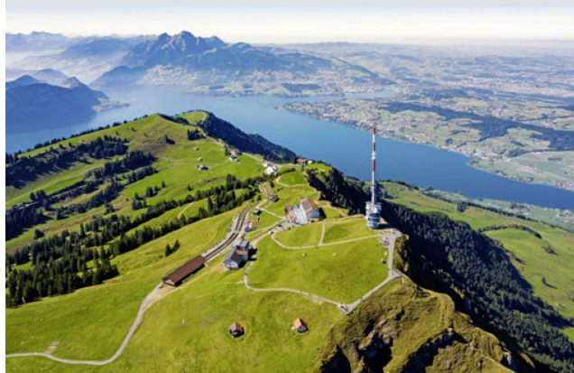
Foto aérea del Rigi con vistas al lago de los Cuatro Cantones, al monte Pilato y a la meseta de Lucerna.

ción activa de más de sesenta jóvenes suizos del extranjero que se unirán a nosotros procedentes de los campamentos de verano, y estará marcado por la presencia de un miembro del Gobierno suizo y la participación del mundo empresarial y la comunidad