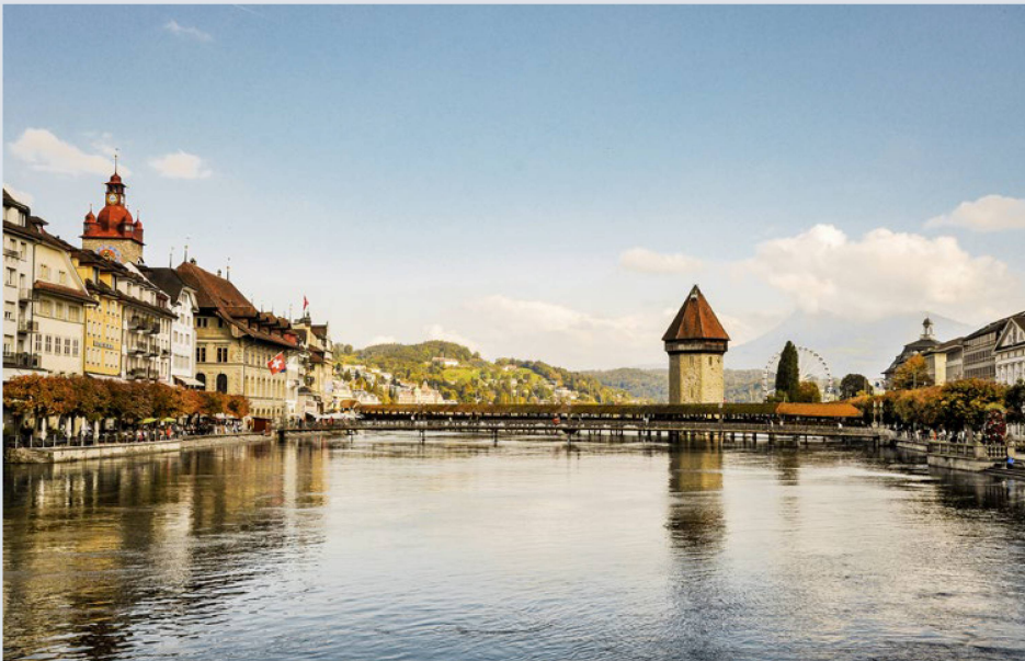
Uno de los símbolos más conocidos de Lucerna es el famoso puente Kapellbrücke, con la torre de agua.

El 100.º Congreso de los Suizos en el Extranjero se celebrará en un maravilloso marco: en Lucerna, con el lago de los Cuatro Cantones y los Alpes como telón de fondo. Pero, sobre todo, se celebrarán tres aniversarios simultáneos y se generarán intercambios enriquecedores.