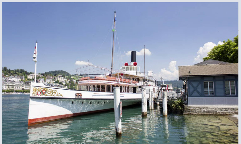
Los barcos son parte de Lucerna: el histórico barco de vapor “Uri”, en el Bahnhofquai.