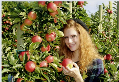
Las 245 profesiones para las que se ofrecen un aprendizaje en Suiza presentan una enorme variedad: desde fruticultora o fruticultor...

Para mayor información y para presentar una solicitud de beca, favor de dirigirse a educationsuisse , Formación en Suiza, Alpenstrasse 26, 3006 Berna, Suiza Tel. +41 31 356 61 04 info@educationsuisse.ch