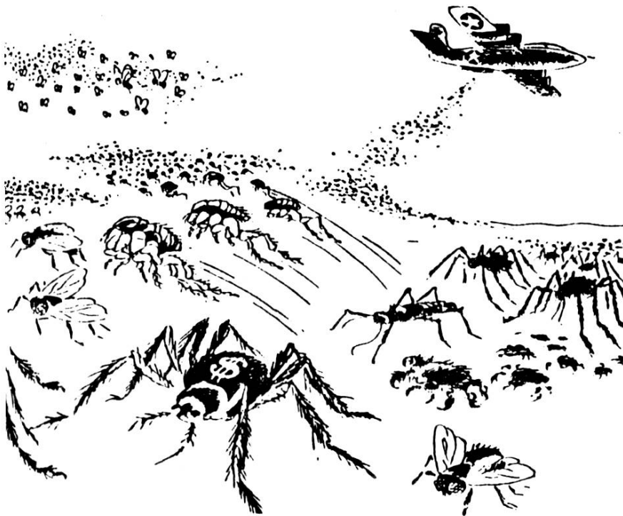
Punaises, mouches, poux, les valeureux combattants de l'Amérique pour la peste et le choléra en Corée et en Chine (Dessin de Herluf Bildstrup, -Land og Folk.)

(10 avril 1952). Et en effet, les agents de la police municipale confisquèrent, à la sortie des écoles, ces petites images qui n'avaient rien à faire dans les mains de jeunes enfants. Le thème de la "guerre bactériologique" (elle ne fut jamais prouvée), amena à une formidable mobilisation antiméricaine, qui culmina en France avec les manifestations contre "Ridgway la peste", où les affrontements