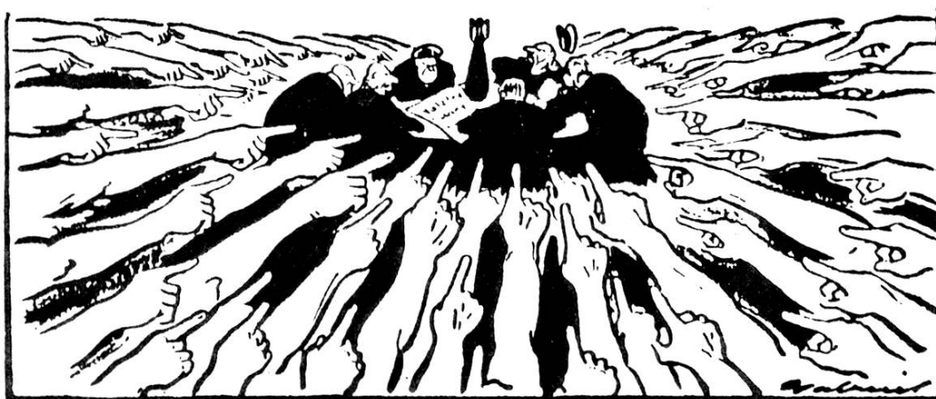
Les stratèges américains devant le succès de l'appel de Stockholm : « Bon Dieu ! Où allons-nous aller faire la guerre à présent ? »

Une fonction particulière est assignée par le mouvement communiste mondial à ce vaste rassemblement des "partisans de la paix" (dont l'intégrité et la sincérité - même si elles s'accompagnèrent parfois d'une grande dose de naïveté - ne sont évidemment pas en cause). Ce mouvement pacifiste des années 50 est tourné - faut-il le dire? - exclusivement contre l'impérialisme américain. L'Appel de Stockholm (1950) contre la bombe atomique - la supériorité nucléaire américaine est alors écrasante - en marque l'apogée. Savants (Einstein, Joliot-Curie...), artistes et écrivains (Gérard Philippe, Yves Montand, Jean Marais, Thomas Mann...), pasteurs et socialistes chrétiens (Arthur Maret, le pasteur Niemöller...), sportifs comme Zatopek, "compagnons de route" du Parti et naturellement militants (Maurice Thorez, le "fils du peuple", n'est-il pas aussi "L'homme de la paix" ?) sont mobilisés. A l'apocalypse nucléaire dont les impérialistes yankees menacent le monde, on oppose l'atome au service de la paix (12). La V.O. ne cesse de souligner les inlassables efforts soviétiques en faveur du désarmement mondial (13), imprégnant les esprits d'une conception claire, simple et manichéenne du monde. Comme le fait d'ailleurs, mais dans l'autre sens, toute la presse bourgeoise des années 50!