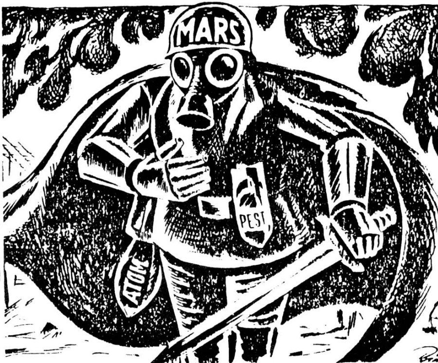
Le dieu du grand capital est prêt

La campagne s'accroît en 1953. En juin, tous les jours un article appelle à la mobilisation populaire pour sauver les époux Rosenberg. En vain.