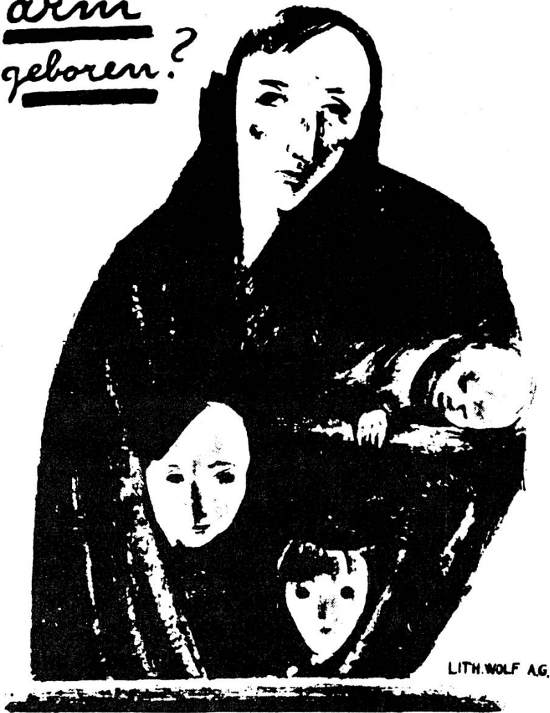
1919, A. H. Pellegrini Nationalratswahlen Basel Lithografie, schwarz, 90,5×128 cm Wolf, Basel