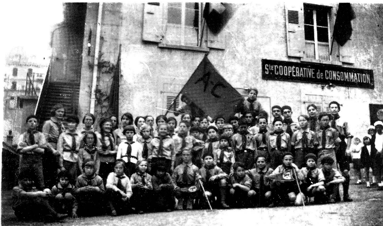
Une photographie symbolique du mouvement ouvrier : un groupe d'Avant-Coureurs devant la Coop (vers 1930).

bénéfice notamment, montrent qu'à défaut de classe ouvrière privilégiée (prédite par la tendance «londonienne» de l'AIT), la coopération a néanmoins engendré un certain nombre de groupes de salariés privilégiés, dont les caractéristiques varient en fonction de données locales. Il faudra attendre la fin du siècle et surtout les deux premières décennies du XXe siècle pour voir le monde ouvrier prendre une place plus importante dans les sociétés de consommation.