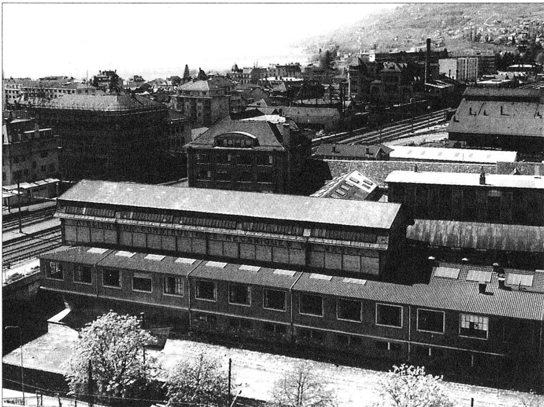
Vue générale des bâtiments situés entre la Veveyse et les rails CFF de la ligne du Simplon (négatif 6 x 6 N° 5669).

Les Ateliers de constructions mécaniques de Vevey (ACMV) sont nés de la fonderie fondée en 1842 par Benjamin Roy qui réparait des machines agricoles et fabriquait des roues de moulin. Dès les années 1870, les ACMV se mirent à diversifier leur production : machines pour le percement du tunnel du Gothard (1874), puis turbines hydro-électriques, tracteurs (les célèbres Vevey ), tram, charpentes métalliques, etc. Les ACMV furent modernisés en 1962, restructurés en 1986 (ramenés à 750 ouvriers), transformés en holding en 1989 et durent fermer leurs portes en 1992. La construction de matériel ferroviaire sera seule poursuivie à Villeneuve sous la raison sociale de Vevey Technologies SA . Les archives de l'entreprise n'ont à notre connaissance pas été conservées... mais, grâce au photographe veveysan Edouard Curchod, des milliers de clichés sur verre et des épreuves sur papier provenant des bureaux de l'entreprise ont été sauvés de la destruction, permettant aujourd'hui de retracer par l'image l'histoire des ACMV.