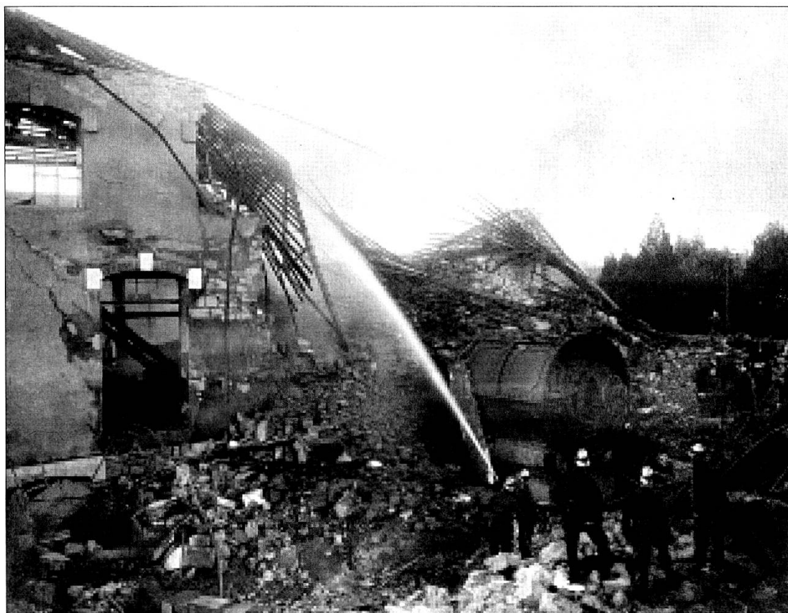
Genève, rue du Stand, août 1909.