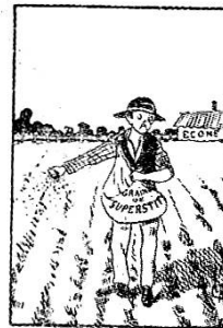
Ce qu'on y sème

L'école d'agriculture d'Écône, instituée par le Saint-Bernard.