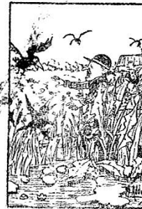
Ce qu'on y récolte