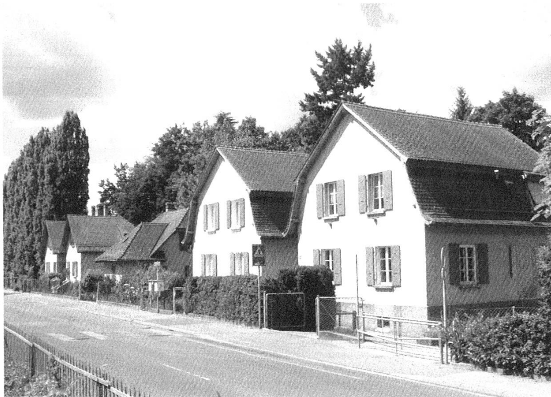
Fig. 2. Les quatre maisons construites aux numéros 31 à 39 de l'avenue Longemalle, à Renens, James Ramelet architecte, 1913. Elles s'étendent le long de l'avenue à la manière d'un catalogue (photo 2008).

Cependant, l'emploi de ce style architectural, qui pouvait passer pour une évidence aux yeux d'un architecte d'envergure locale comme l'était James Ramelet, n'est pas sans conséquence sur la conception de maisons souhaitées «à bon marché». L'importance des toitures, évoquant les constructions rurales et bourgeoises de l'époque baroque, a pour désavantage, par exemple, de créer à la base des combles de nombreux espaces de faible hauteur. Ces volumes quasiment inutilisables sont reconvertis en de multiples lieux de rangement, dont la fonction ne parvient toutefois pas à compenser le surcoût esthétique. Ainsi, dans la petite maison individuelle (type B), la réalisation d'un étage ne permet de loger qu'une seule chambre, le reste du niveau supérieur étant occupé par une