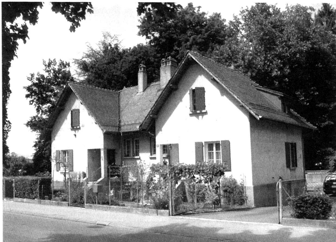
Fig. 3. Av. Longemalle 31-33, Renens, James Ramelet architecte, 1913. Il s'agit du type G, composé de deux maisons jumelles possédant chacune quatre chambres. À noter, la séparation clairement marquée entre les deux entrées (photo 2008).