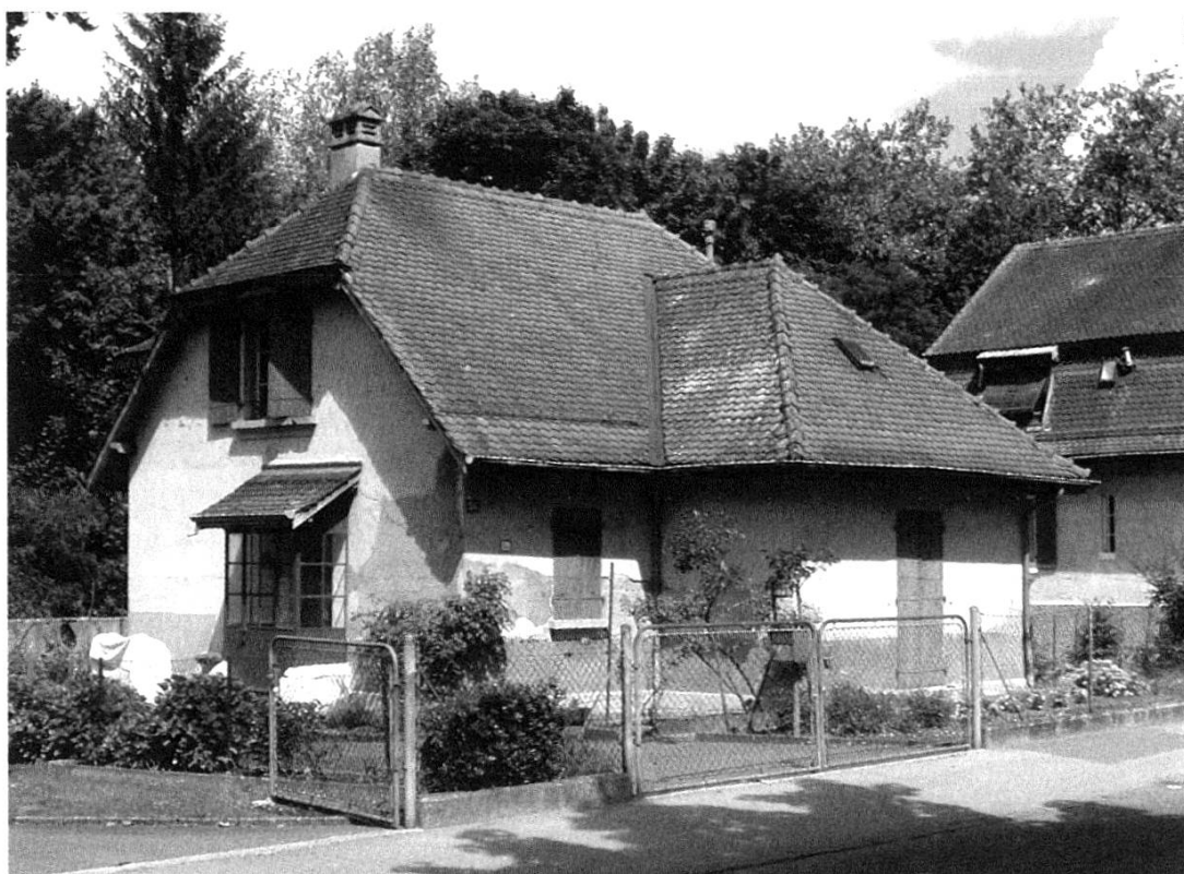
Fig. 4. Av. Longemalle 35, Renens, James Ramelet architecte, 1913. Type B, trois chambres. Malgré une toiture au volume relativement important, l'étage ne comporte qu'une seule chambre habitable, repérable à sa fenêtre. À noter, l'espace notable accordé au jardin (photo 2008).