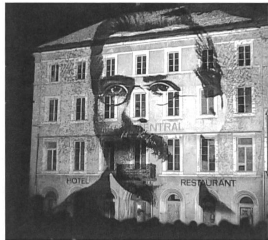
9. Performance de Gerry Hofstetter, Printemps 08 (Saint-Imier, 2008).

Afin que ce mécanisme fonctionne, il nécessite un travail de médiation des connaisseurs de l'histoire du lieu. En outre, la présence d'objets témoins de l'époque est fondamentale. L'ancienne Maison de Ville, connue aussi sous le nom d'Hôtel Central, lieu du congrès de 1872, revêt cette fonction. Les rencontres commémoratives, comme celle de 2012 avec des centaines de participants venus de tous les continents, n'auraient pas eu le même impact si ce bâtiment historique avait disparu, ce qui faillit arriver. Saint-Imier souffrait depuis les années 1970 d'une crise économique et d'un grand dépeuplement, de sorte que le bâtiment resta vide pendant des années. Une action culturelle nommée Printemps 08 fut lancée pour éviter que l'Hôtel Central ne disparaisse. Le point culminant de celle-ci fut une performance de l'artiste Gerry Hofstetter (voir ill. 9) qui projeta des images en lien avec l'anarchisme sur la façade du bâtiment vide. Hofstetter redonna ainsi vie au bâtiment et le transforma en lieu de mémoire historique digne de conservation, comme envisagé par le comité d'organisation du Printemps 08 : «Nous ne laissons pas disparaître ce témoin