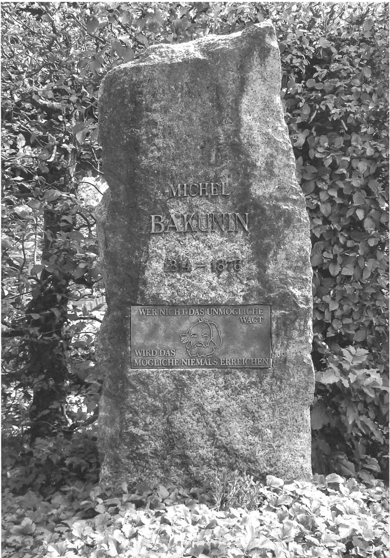
7. Tombe de Bakounine (Berne, 1876).