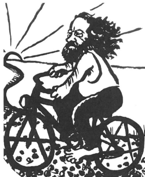
6. Caricature de Bakounine par David Orange, 2015.

Les tombes et les cimetières sont pourtant depuis toujours un terrain de différenciation des anarchistes, sans toutefois chercher une rupture totale avec la pratique de l'enterrement des morts et de leur souvenir par des tombes. La Fédération jurassienne fonda en 1877 une Association d'assurance mutuelle pour les cas de maladie qui prévoyait selon l'article 21 de ses statuts une somme de trente francs pour les frais d'inhumation d'un compagnon, « mais seulement si l'enterrement est civil » 17 . Ces principes laïcs se manifestèrent lors des deux premiers enterrements connus par les sources, en 1876, sans la présence d'un prêtre. Le 3 juillet, au cimetière de Bremgarten à Berne, des discours furent prononcés à l'occasion de l'enterrement de Bakounine 18 ; et le 11 août, à Sonvilier, les horlogers de la Fédération jurassienne rendirent