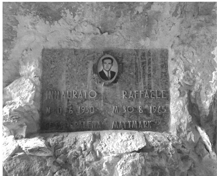
21. Plaque privée (Mattmark, 1970?).

Que les plaques commémoratives représentent une prise de position interprétative, et donc politique, se perçoit également par l'absence de toute intervention des autorités jusqu'aux années 1980. Il fallait cacher la catastrophe, une « honte » 27 dans l'histoire de l'industrialisation suisse, d'une manière ou d'autre, en la faisant apparaître comme un événement parmi d'autres (les morts de 1960 à 1967, sans précisément indiquer la catastrophe de l'année 1965). Il n'est donc pas surprenant que des plaques, qu'on pourrait qualifier d'alternatives, apparaissent, posées sans autorisation, dans les alentours de Mattmark. Elles ne furent pas inaugurées par des instances officielles, mais tolérées car inoffensives quant à leur contenu. Ces plaques commémoratives avec des représentations privées sont généralement placées sur le chantier où le décès a eu lieu, à l'exemple de l'illustration ci-contre qui reprend l'iconographie des urnes des cimetières italiens.