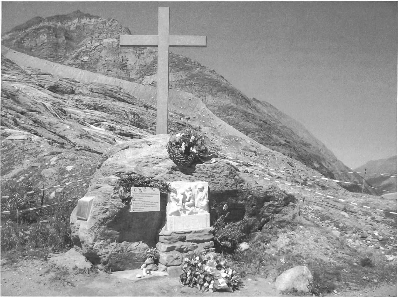
20. Mémorial (Mattmark).

Le concept de catastrophe, comme on le considère aujourd’hui – synonyme de catastrophe naturelle, tragédie, issue malheureuse – a connu un «renouvellement sémantique [qui] correspond bien au paradigme d’une radicale séparation de l’homme et de la nature, dominant au XIX e siècle. La nature apparaît alors comme un ensemble de forces et de phénomènes dont la science s’efforce de comprendre les mécanismes, et la technique d’en proposer la maîtrise. D’une certaine manière, on pourrait dire que l’émergence d’une pensée de la catastrophe naît du divorce entre l’homme et la nature caractéristique de la modernité» 8 .