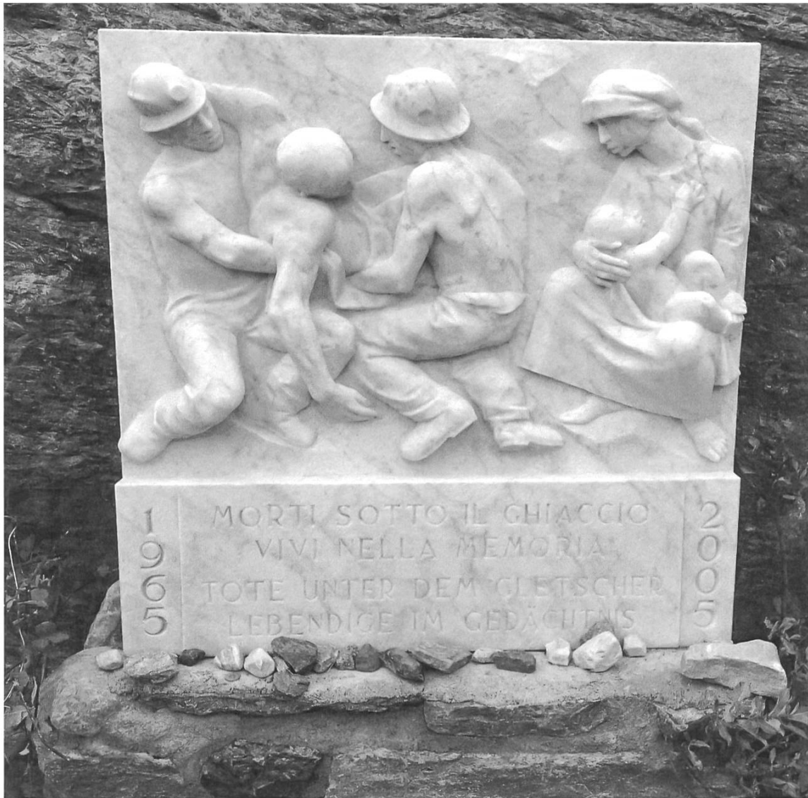
23. Plaque (Mattmark, 2005). Photographie Toni Ricciardi

placée le 30 août 2015, sur le lieu précis de la tragédie, comme pour les plaques posées en 1990 et en 2005 (voir ill. 23), près d'une grosse pierre à la base d'une grande croix, symbole du deuil chrétien de la tragédie (voir ill. 20). La plaque de 1990, avec une phrase dans les trois principales langues nationales et aussi en latin ( In memoriam eorum qui perierunt mole montis glaciata fracta ), langue du culte par excellence, fut placée en août par la Comunità italo-svizzera . Celle posée pour le 40 e anniversaire par la communauté italienne en Valais fait appel à la pietas chrétienne, avec deux sauveteurs qui soulèvent le corps sans vie d'une victime et une femme avec son fils qui observe la scène