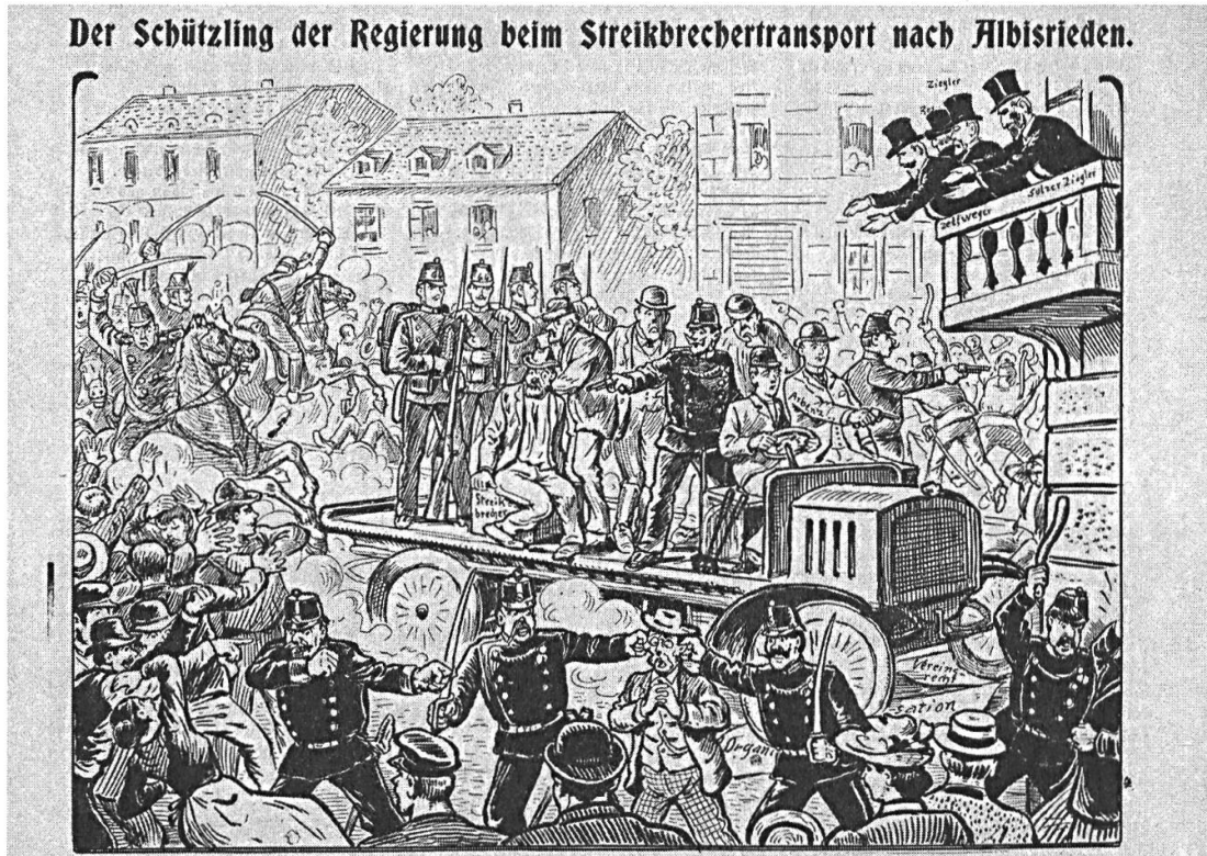
Die grütlianische Satirezeitschrift Der Neue Postillon zum Zürcher Streiksommer 1906.

der Sozialdemokratie für ein Verbot solcher Einsätze aus. 25 Damit hatten sich Ordnungstruppen als Feindbild etabliert, das im November 1918 die militärische Besetzung Zürichs zu einer ungeheuren Provokation machen sollte.