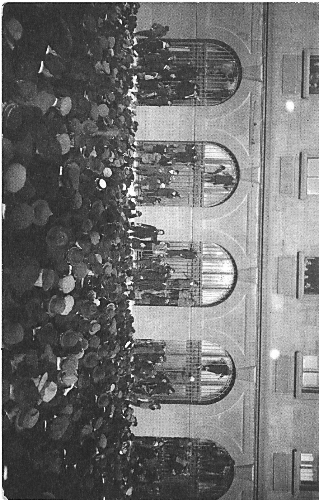
Jules Humbert-Droz, au centre, s'adresse aux grévistes qui occuperont ensuite les voies pour empêcher le départ d'un train, La Chaux-de-Fonds, 14 novembre 1918. Carte postale, [s.l.] : [s.n.]. Bibliothèque de la Ville de La Chaux-de-Fonds, Cabinet des arts graphiques, Fonds cartes postales.