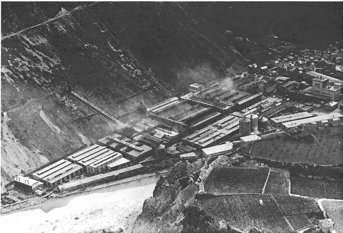
L'usine Alusuisse, ses fumées et le vieux village de Chippis en 1963. © Comet Photo AG, ETH-Bibliothek Zürich, Com_F63-01419.