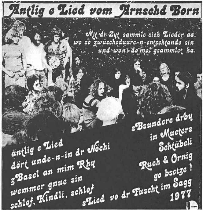
Pochette et extrait du livret de l'album. Sur la photo du verso de l'album, on reconnaît Aernschd Born à droite, avec barbe et cheveux longs, lors d'un de ses concerts.