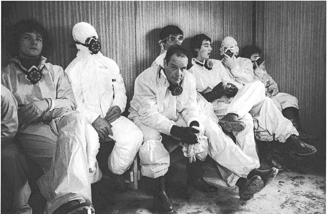
Grève des ouvriers d'ICMESA, qui refusent de poursuivre les travaux de décontamination en raison de l'absence de mesures de sécurité. Photographie Dino Fracchia, Milan, 1976. Avec l'aimable autorisation de l'auteur.

illégal dans leurs habitations situées dans la zone contaminée. La conflictualité atteint aussi des installations de Roche en Italie ou des maisons de responsables en Suisse et en Italie, avec notamment des attaques à la bombe ou l'assassinat de l'ancien responsable de la production de l'ICMESA.