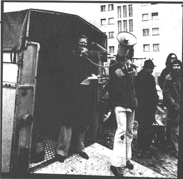
UNE PAYSANNE VA PRENDRE LA PAROLE

Plusieurs centaines de paysans et ouvriers ont participé samedi 9 février, dans un quartier de Fribourg, à une action dénonçant les responsables de la vie chère. C'est le début d'une action commune de différents groupes qui défendent les mêmes idées face à la montée des prix. Ces marchés libres auront lieu dans toute la Suisse romande: Fribourg, Cossonay, Penthalaz, Renens, Lausanne, Romont et Yverdon.