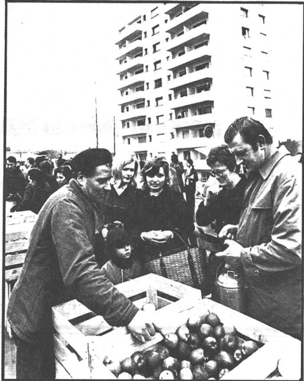
C'EST VRAI QUE C'EST PAS CHER.