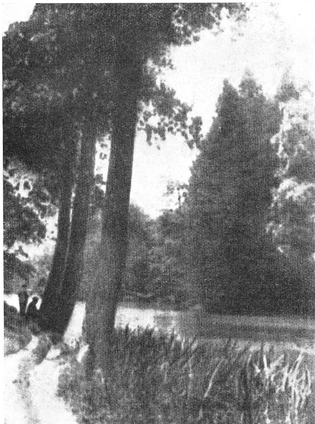
Abb. 3. Uebermittelte Photographie.

Beim Empfang von Schriftstücken oder Zeichnungen wird die Glasscheibe durch eine Messingplatte mit schmalen senkrechten Spalten ersetzt; im übrigen ist der Empfang derselbe.