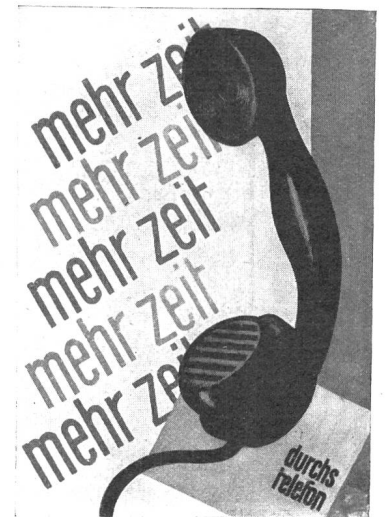
Hel. Haasbauer, Basel (2. Rang).