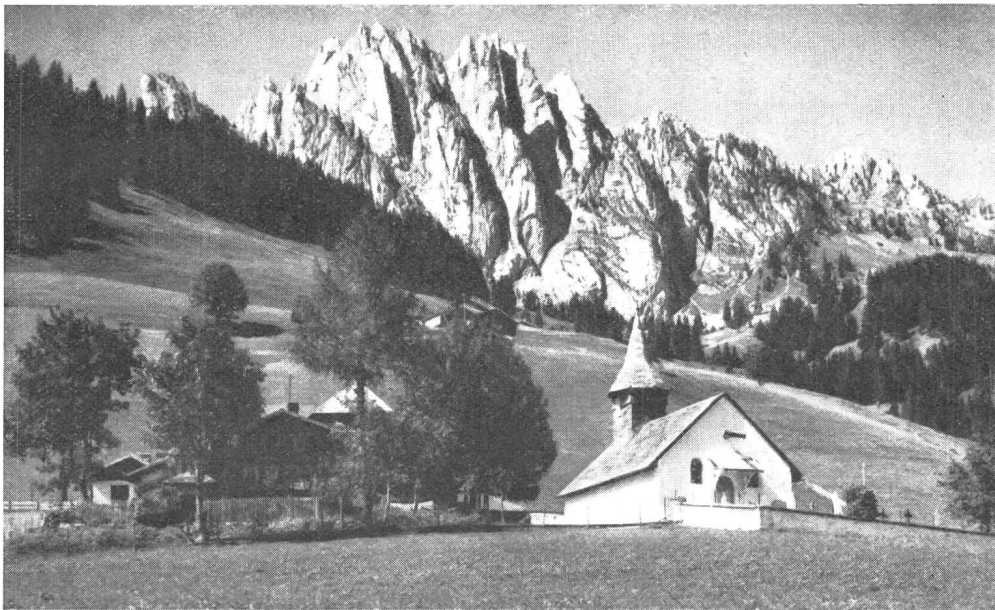
Das Kirchlein von Abländschen.