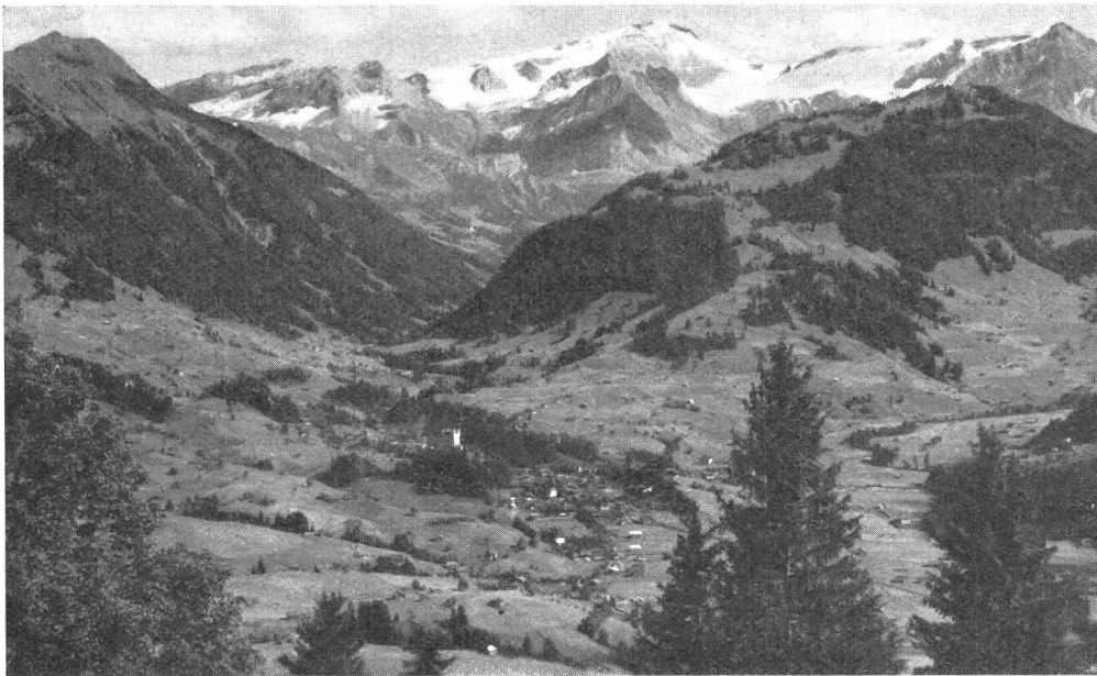
Gstaad mit Wildhorn.