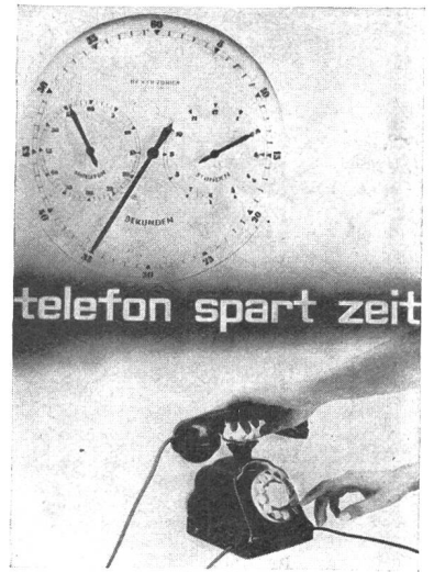
Max Bill, Zürich (2. Rang).

Wettbewerbe sind infolge des grossen Leerlaufes umständlich und kostspielig. Die Hoffnung, ein unbekanntes Talent unverdientem Dunkel zu entreissen, ging auch diesmal nicht in Erfüllung. Umso mehr sind wir dem Eidg. Departement des Innern für die Veranstaltung des Wettbewerbes dankbar. Wir hoffen, dass ein späterer, engerer Wettbewerb, zu welchem nur bewährte Graphiker eingeladen werden sollten, ein brauchbares Ergebnis zeitigen wird.