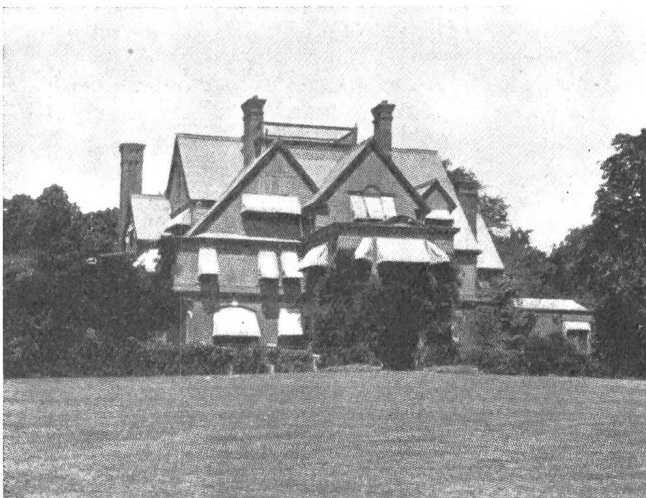
Fig. 15. Edisons Heim in Llewellyn Park. La maison d'habitation d'Edison à Llewellyn Park.

Antérieurement à Edison, divers inventeurs s'étaient déjà intéressés au problème du cinématographe. Edison rappelle lui-même qu'il est redevable de son invention à deux de ses prédécesseurs, le français Marey et l'américain Muybridge. Marey, l'inventeur du photochronographe, était parvenu à fixer photographiquement les mouvements d'un homme en marche et ceux d'un oiseau en plein vol.