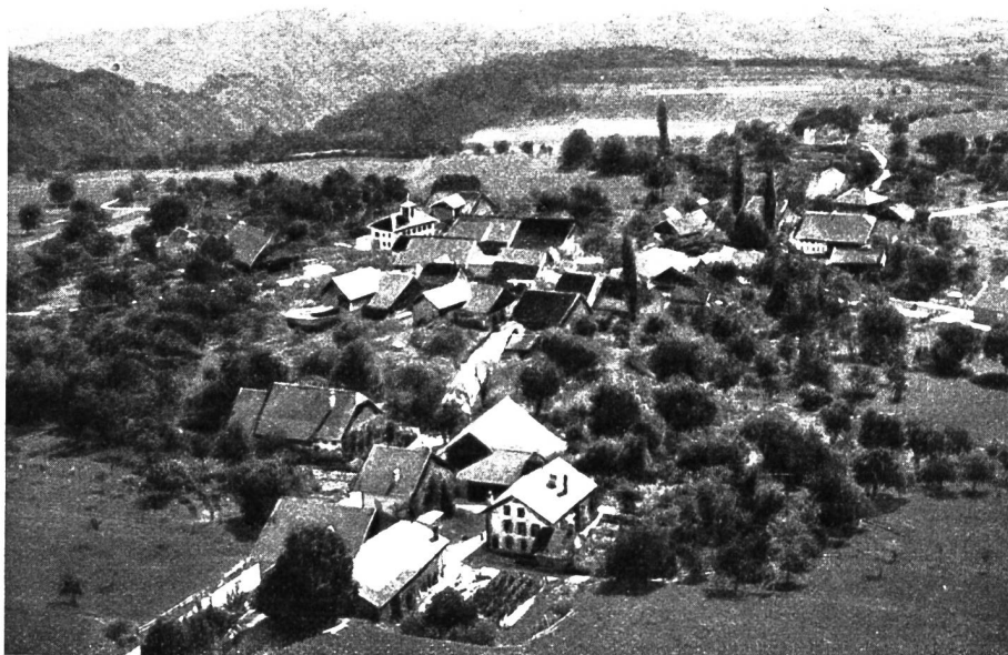
Le village de Sottens.

que lui versait le métral et 11 sols et 5 chapons que lui livrait annuellement le meunier. Les communiens de Sottens devaient les corvées, soit chaque feu ou ménage deux journées de charrue au printemps (une à cause des marais), une au temps des sémorailles (semailles) et une en automne à la Saint-Martin. Le vidomne conclut le 28 avril 1364 avec les communiens une convention suivant laquelle ceux-ci remplaceraient les corvées par le versement de 8 sols et 9 deniers par feu, ce qui correspond à une cinquantaine de francs de nos jours. Il y avait à ce moment 14 focagers ou chefs de famille. Le vidomne avait lui-même à Sottens un intendant, le métral, qui, le 16 novembre 1345, reconnaît tenir de lui, pour lui et ses descendants, l'office de la métralie.