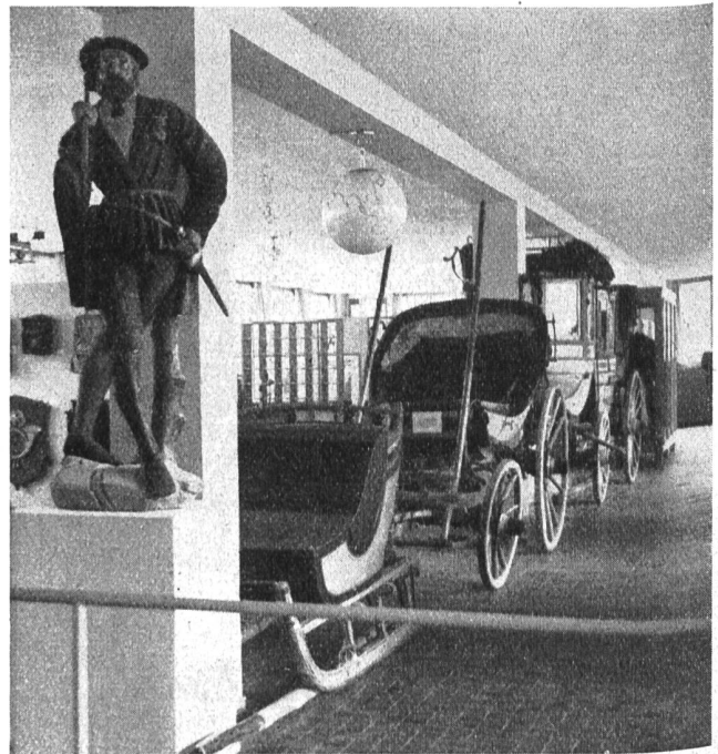
Abb. 1. Statue des Standesläufers Urs Lerber in Bern. Bergschlitten aus Graubünden, alter Riemenwagen für Personentransporte über den Gotthard (um 1830) und achtplätziges Grimselpostkutsche.

Was bietet das neue Museum? Da ist zunächst eine geschichtliche Abteilung , die Auskunft gibt über das Schicksal der Post bis zum Aufkommen der Bahnen. Besonders eingehend sind die bernischen Verhältnisse geschildert, mit denen der Name der Familie von Fischer unlösbar verknüpft ist. Gleich am Eingang empfängt uns ein Postbote in mittelalterlicher Tracht — freilich ein bisschen steif, denn er ist aus Gips und darum gerade so ungelinkig