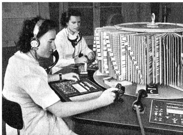
Bedienungsplatte und Cardextrommel Chur — Station plaque et tourniquet Coire.

die zur Aufnahme der Adressenstreifen dienen. Diese rotierenden Verzeichnisse sind sehr praktisch, solange ihre Aufnahmefähigkeit kleiner ist als 175 000 Adressen. Grössere Anlagen sind unpraktisch, weil sie infolge ihres Gewichtes schwer zu drehen sind, weil die Flügel nicht genügend geöffnet werden können, und hauptsächlich, weil die Telephonistinnen sich gegenseitig behindern, wenn sie zu dreien oder vierten den Apparat gleichzeitig benützen wollen, und die eine nach rechts, die andere dagegen nach links drehen möchte. Unter der untersten Trommel befindet sich eine runde Platte, die auf derselben Achse frei montiert ist; sie dient zur Aufnahme der Register und der verschiedenen Verzeichnisse, die wenig benötigt werden und daher nur in einer Anflage vorhanden sein müssen.