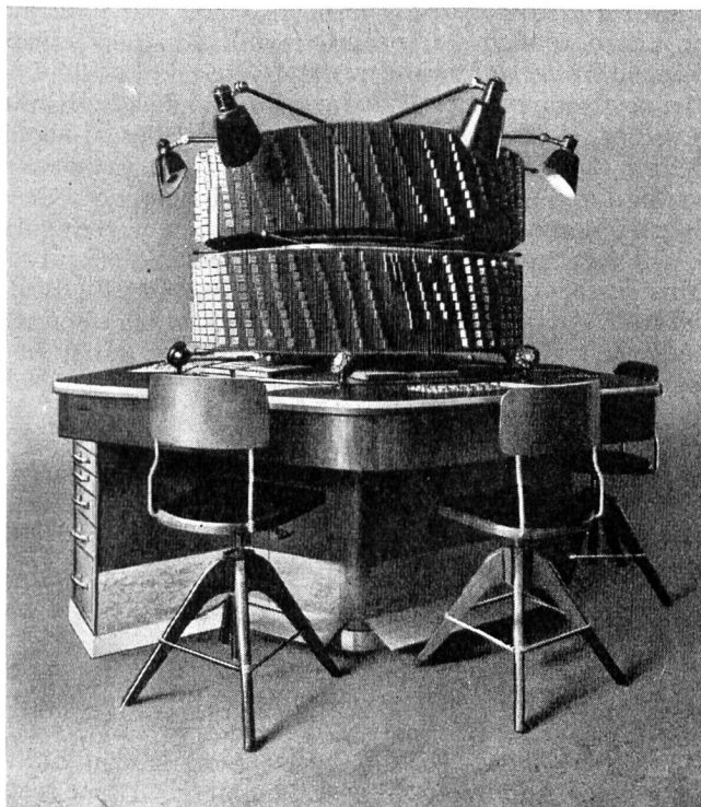
Auskunftstisch Lausanne - Pupitre des renseignements Lausanne.

In grossen Städten ist der Auskunftsdienst am Inseratendienst beteiligt. Sie kennen die sogenannten Chiffre-Inserate, wie „Aussteuer zu verkaufen, sich wenden an die Expedition der Zeitung unter Chiffre Nr. X4519 oder an Nr. 11“. Die Nr. 11 gibt demjenigen, der sich an sie wendet, die Adresse des Inserenten bekannt.