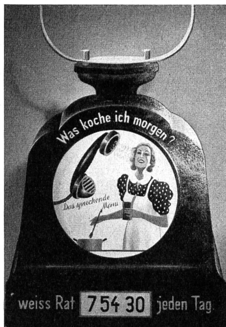
Abb. 2. Schaufenster-Reklame für Lebensmittelgeschäfte (Entwurf Gaswerk).

Sobald die Maschine I die 4—6 Minuten dauernde Sendung beendet hat, schaltet sich Maschine II ein und übernimmt die Sendung. Unterdessen wird der Stahldraht der ersten Maschine automatisch mit dreifacher Geschwindigkeit in die Anfangsstellung zurückgespult. Der erste Anruf setzt die Anlage in Betrieb; mit dem Aufheben der letzten Verbindung wird sie abgeschaltet. Damit das gesprochene Menu sofort mit voller Lautstärke vernehmbar ist, sind die Verstärker während der Betriebszeit dauernd eingeschaltet.