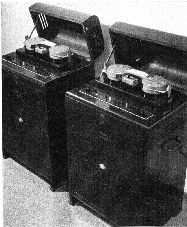
Abb. 1. Textophon-Maschinengruppe in der Telephonzentrale.

Sobald die Maschine I die 4—6 Minuten dauernde Sendung beendet hat, schaltet sich Maschine II ein und übernimmt die Sendung. Unterdessen wird der Stahldraht der ersten Maschine automatisch mit dreifacher Geschwindigkeit in die Anfangsstellung zurückgespult. Der erste Anruf setzt die Anlage in Betrieb; mit dem Aufheben der letzten Verbindung wird sie abgeschaltet. Damit das gesprochene Menu sofort mit voller Lautstärke vernehmbar ist, sind die Verstärker während der Betriebszeit dauernd eingeschaltet.