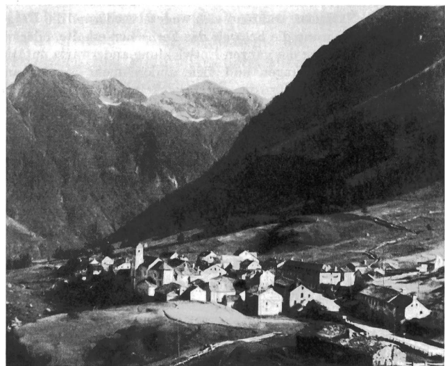
Fig. 1. Simplon-Dorf, 1475 m ü. M.

Die Simplonstrasse verbindet Brig mit dem italienischen Domodossola und überwindet dabei die 2009 m ü. M. gelegene Simplon-Passhöhe. Auf Befehl Napoleons I. wurde in den Jahren 1800...1806 eine Fahrstrasse gebaut, die den früheren Römerpfad ersetzte und in ihrer Führung im wesentlichen auch für die heutige Paßstrasse bestimmend blieb. Vom Rhonetal aus, in steilem Aufstieg, in südöstlicher Richtung die Saltineschlucht überwindend, erreicht der Wanderer durch das seitlich einmündende Gantertal die 23,2 km entfernte Simplon-Passhöhe, am Fusse des Monte Leone. Der Aufstieg durch dieses zerklüftete, stark bewaldete Tal hinterlässt einen tiefen Eindruck. Der Abstieg südwärts führt durch ein ödes, steiniges Hochtal nach dem 8,5 km talwärts gelegenen Simplon-Dorf, das in einer Höhe von 1480 m am Fusse des Fletschornes liegt. Unterhalb Simplon-Dorf biegt