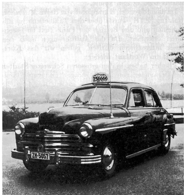
Fig. 1. Funk-Taxi der Fa. Welti-Furrer AG. Auf dem linken Kotflügel befindet sich eine ausziehbare Antenne, die zum Senden und Empfangen dient

menen Funk-Taxi wohl die ersten auf dem europäischen Kontinent seien, die einen selektiven Aufruf gestatten. Er erklärte ferner die Beweggründe, die zur Bezeichnung «Funk-Taxi» geführt hätten. Obwohl der Begriff «Funk» aus einer Zeit stamme, da man noch mit Funkenstrecken gearbeitet habe,