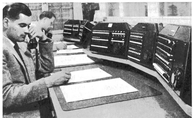
Fig. 5. Arbeitsplätze der Telephondisponenten

Im Bureau des Telephondisponenten wurde die Anlage von zwei auf drei Bedienungsstationen erhöht. Die dritte Station dient ausschliesslich dem Gegenverkehr mit den Funk-Taxi. Entsprechend der bestehenden Telephonanlage wurde auch die Funkbedienung zweifach ausgeführt, damit bei Stosszeiten zwei Telephondisponenten eingesetzt werden können. Ihre Hauptaufgabe besteht darin, jede eingehende Taxibestellung unverzüglich demjenigen Wagen aufzugeben, der dem Bestellort am nächsten steht. Der Disponent muss dazu nicht nur das ganze Strassennetz Zürichs, 60...70 Chauffeure und das gesamte Wagenmaterial kennen, sondern auch alle möglichen Sonderwünsche der Kundschaft in Erinnerung behalten und ausführen. Zur Lösung dieser vielseitigen Aufgabe bietet ihm eine automatische Telephonanlage — und von nun an auch die Funkeinrichtung — wertvolle Unterstützung. Der Telephonist verfügte bisher über eine Bedienungsstation für die Gespräche mit den Kunden (Telephonnetz) und eine weitere für die Verbindungen mit den Taxi-standplätzen. Jetzt dient ihm die dritte Station für Verbindungen mit den Funk-Taxi, wobei jeder Wagen durch Drücken einer entsprechenden Taste sofort