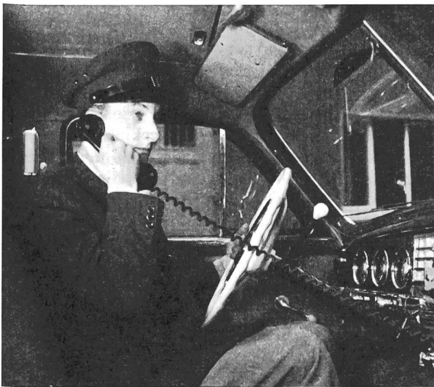
Fig. 4. Taxi-Chauffeur im Gespräch mit dem Telephondisponenten

PTT nur für Betriebe mit mindestens 15 Fahrzeugen gestattet.)