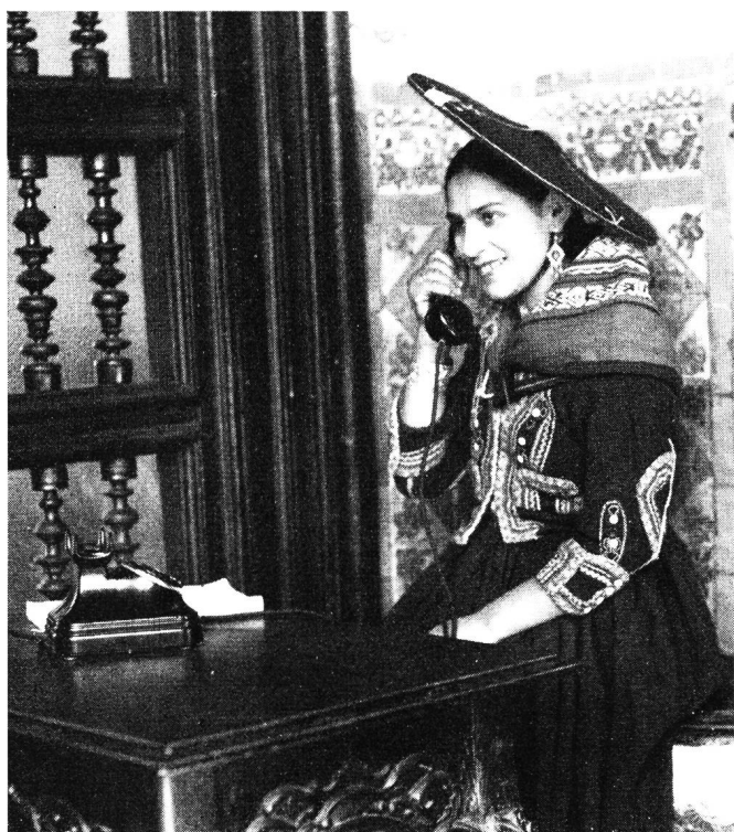
Fig. 1. Das Telephon erobert die Welt. Peruanische Frau in der Landestracht am Telephon im Palast Torre Tagle, der ehemaligen Residenz der Vizekönige von Peru Le téléphone conquiert le monde. Femme péruvienne, en costume national, téléphonant dans le palais Torre Tagle, l'ancienne résidence des vice-rois du Pérou

La statistique téléphonique mondiale se rapportant au 1 er janvier 1955, publiée par l'«American Telephone and Telegraph Company» (ATT), est caractérisée par l'augmentation constante des postes téléphoniques à la suite de la haute conjoncture qui règne à peu près partout. Les obstacles que la guerre opposait au développement normal du téléphone ont été depuis longtemps surmontés; les chiffres suivants prouvent d'une façon péremptoire que, ces dix dernières années, le téléphone est devenu toujours davantage, du moins en Amérique et en Europe, un objet d'usage courant indispensable même aux gens les plus simples.