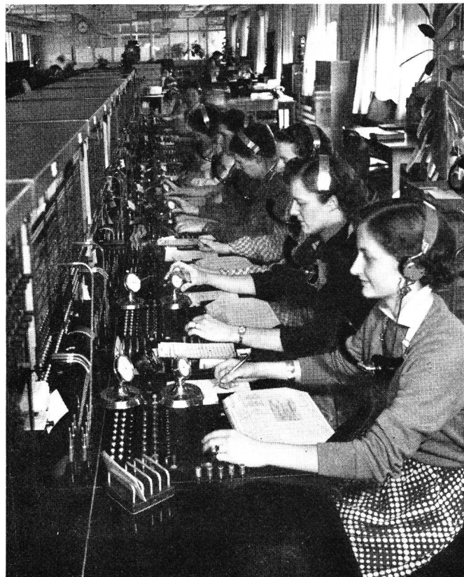
Fig. 3. Der Überseedienst im Fernamt Bern

Gegenwärtig ist eine neue Zentrale für 5400 Anschlüsse – mit Erweiterungsmöglichkeit auf 12 000 – in der Gemeinde Köniz im Bau und die Zentrale Breitenrain wird von 7200 auf 10 000 Anschlüsse erweitert. In den nächsten Jahren sind auch neue Zentralen für je etwa 5000 Teilnehmeranschlüsse in Wabern und Ostermundigen in Aussicht genommen, während die Zentrale Bümpliz auf 10 000 Anschlüsse erweitert werden soll. Ausserdem