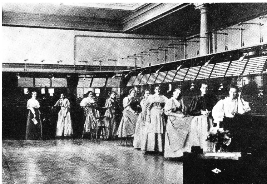
Fig. 2. Telefonzentrale Bern um 1896

Kabel eingezogen und in die Nebenstrassen verteilt werden konnten.