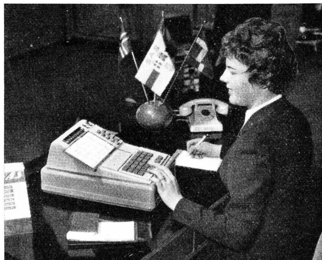
Fig. 2. Apparecchio di domanda, manovrabile con una sola mano, anche da persone poco pratiche della telescrivente. Le informazioni corrispondenti ai tasti premuti vengono convertite automaticamente in impulsi elettrici di telescrivente

L'échange des informations entre l'appareil de demande et l'installation d'interprétation des données se fait au moyen des impulsions de courant usuelles dans la correspondance par télé-imprimeur, soit à une vitesse de 6,6 signaux à la seconde ou 24 000 signaux à l'heure. Lors de la commande de chaque bouton de l'appareil de demande, les conversions nécessaires sont faites