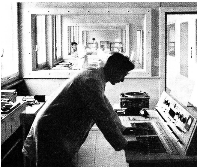
Fig. 2. Blick in die Senderäume des Kurzwellendienstes während der Montagearbeiten

Das Gebäude beherbergt im Erdgeschoss die technischen Anlagen und die Studios des Schweizerischen Kurzwellendienstes, während im ersten, zweiten und zum Teil im dritten Obergeschoss die vielsprachigen Programmzweige und die Direktion des KWD