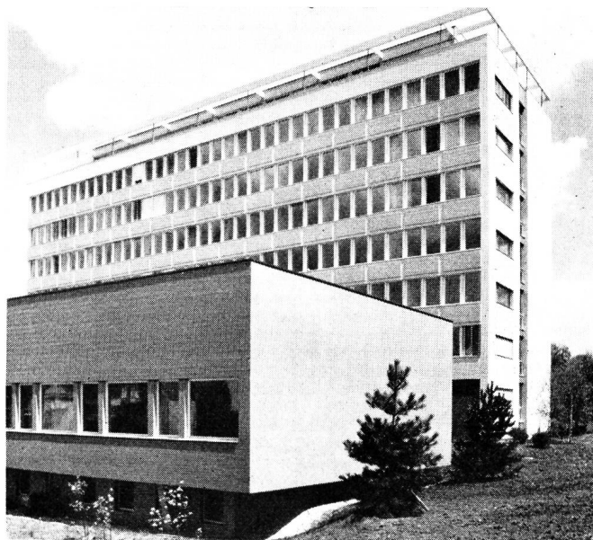
Fig. 1. Der Neubau der SRG an der Giacomettistrasse in Bern. Im Vordergrund der Anbau für den Kurzwellendienst

untergebracht sind. Ebenfalls im ersten Stock befinden sich die Räume der Programmleitung des Telephonrundspruchs sowie dessen künftiges Schaltzentrum. Das vierte bis sechste Obergeschoss wird von der Generaldirektion der SRG beansprucht. Im sechsten Stock liegen ferner zwei grosse Konferenzräume für die Sitzungen des Zentralvorstandes der SRG und die Direktorenkonferenzen der Landessender. Im Dachgeschoss, mit herrlicher Aussicht auf die Berner Alpen und die Stadt, ist der Erfrischungsraum für das Personal und die Wohnung des Abwartes untergebracht.