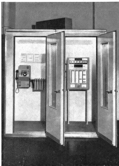
Fig. 3 Telephonkabinen mit der neuen Autelca-Kassierstation (links) und der Kassierstation System Sodeco (rechts)

nationalen Selbstwahlverkehr ( Fig. 3 ). Zwei Autelca-Stationen standen auch in öffentlichen Kabinen in Montreux im Betrieb.