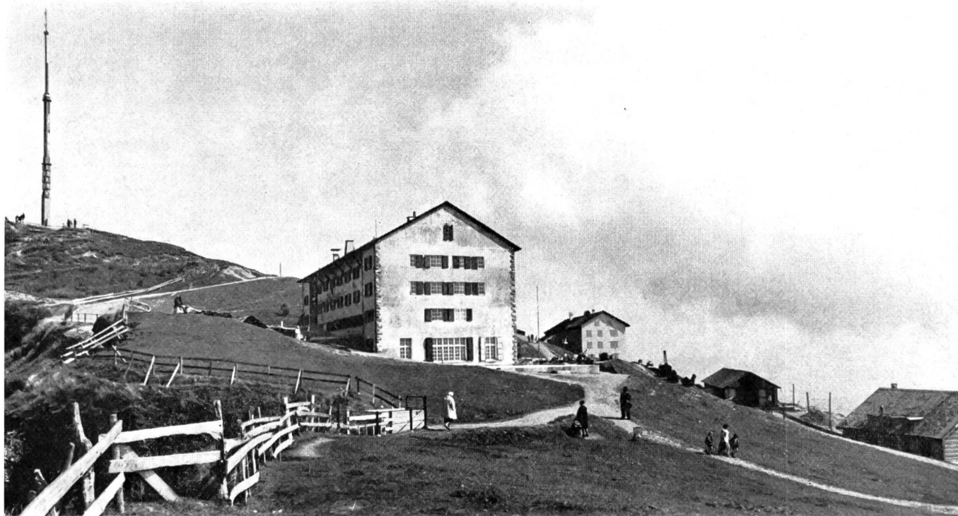
Rigi-Kulm mit (von links nach rechts) Antennenturm, Kulm-Hotel, Dependence/PTT-Betriebsgebäude, Bahnschuppen und Bergbahnstation

Ebenso falsch sei übrigens die von gleicher Seite aufgestellte Behauptung, durch eine systematische Unterdrückung grösserer