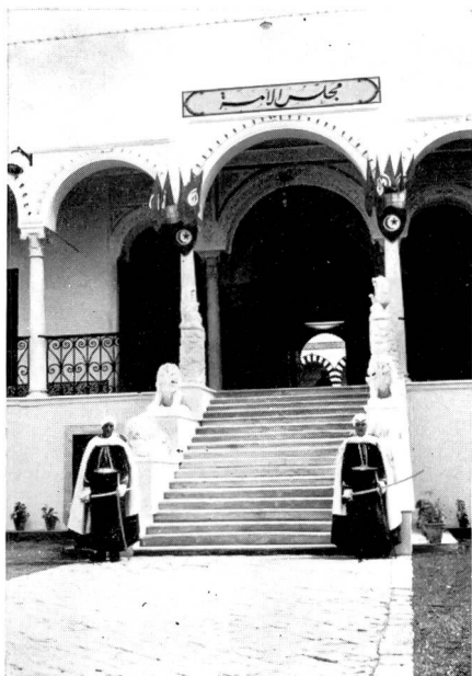
Wache vor dem Sitz des Präsidenten und der Nationalversammlung

Am Feierabend wurden wir durch spontan angebotene Gastfreundschaft verwöhnt. So mussten wir unbedingt den starken Feigenschnaps «Boukha» kosten, der mit unzähligen, teilweise unbekanntem Zutaten serviert wird. Ein liebevoll zubereitetes Cous-Cous, das Nationalgericht, gehört ebenfalls zu unsern Erinnerungen. Andere Leckerbissen, wie Briks, ein mit Thon oder