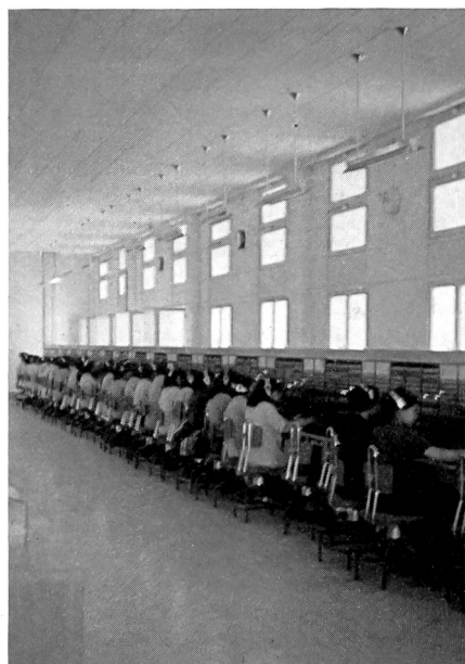
Nationales manuelles Vermittlungsamt Tunis