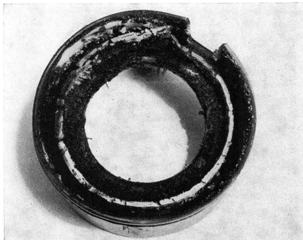
Fig. 4 Brennring Webasto-Heizung: Stand-Versuchslauf mit Zusatz bis Totalausfall, 52 Stunden

Der Vollständigkeit halber sei ein weiterer, seit kurzem laufender Versuch mit einem englischen Zusatz erwähnt, der nicht eine Rauchverminderung, sondern die Beseitigung des unangenehmen Geruches der Diesel-Auspuffgase bezweckt. Die Resultate des Versuches bestätigen tatsächlich eine günstige Einwirkung auf den üblen Geruch des Dieselrauches, und, was noch wichtiger erscheint, damit wird auch eine Unterbindung der bekannten, ätzenden Reizwirkung auf Augen und Atmungsorgane